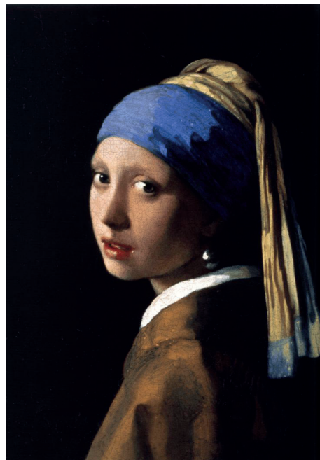
Moça com o brinco de pérola